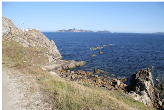
Punta Meda e Illas Cíes.