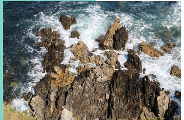
Mesturas de granitos e gneis