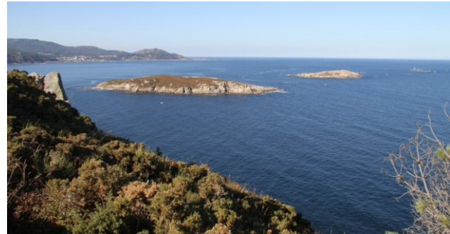
Illas Estelas desde a punta de San Bieito.

E estando en Panxón non podemos deixar de facerlle unha visita á igrexa deseñada polo arquitecto Antonio Palacios. Unha xoia de armonía e do característico estilo do autor.