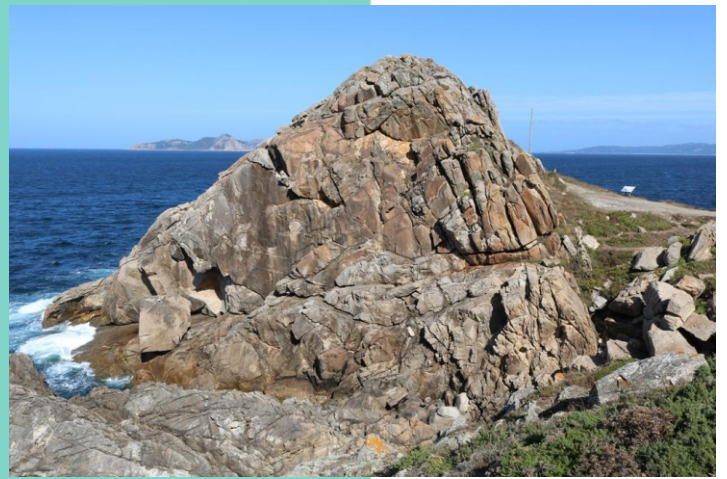
Punta Meda .