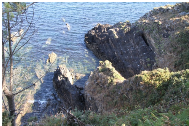
Cantís na Punta Meda.