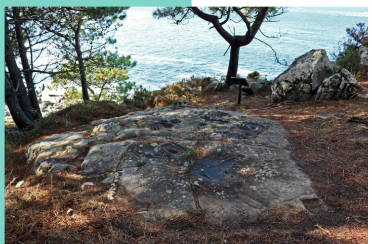
Petroglifos e muíños rupestres das Penisas Pequenas