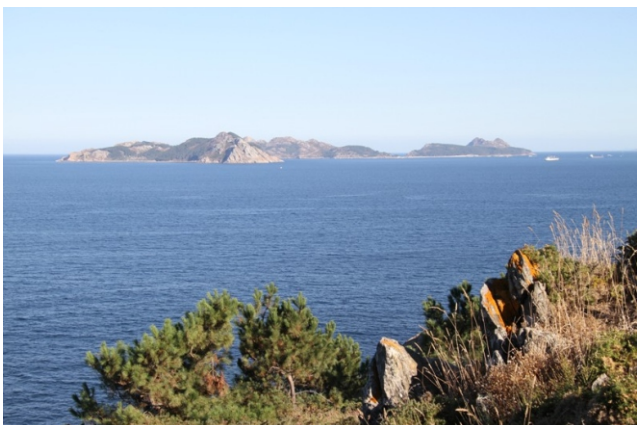
Illas Cíes desde Monteferro.